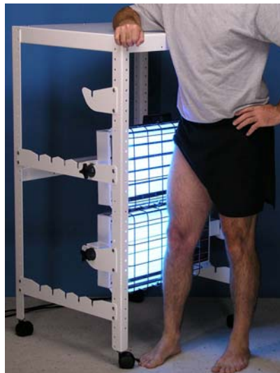
O apile los equipos para crear un pequeño panel.