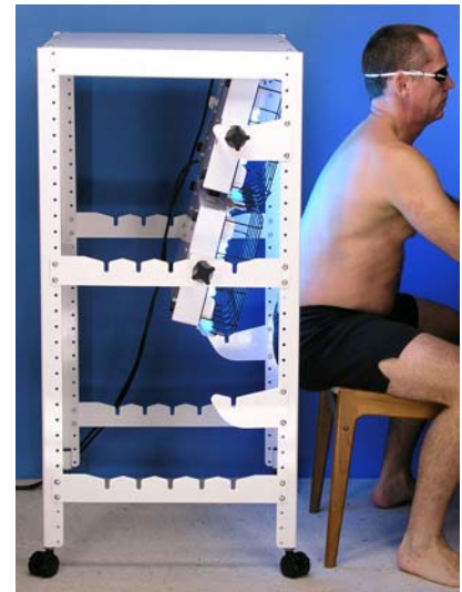
Las posibilidades son infinitas...

El SolRx 550UVB-NB-CR "Clasificación Clínica" proporciona máxima versatilidad para clínicas muy activas. Modernas lámparas fluorescentes compactas Philips PL-L36W/01 de 36 vatios proporcionan considerablemente mayor Irradiancia UVB-Banda Estrecha y tiempos de tratamientos más cortos que los equipos de la competencia con lámparas convencionales "T12" de 20 vatios. Con dos equipos montados en el Carro de Posición adicional, las posibilidades de tratamiento son infinitas. También disponible en UVB-Banda Ancha, UVA o UVA1.