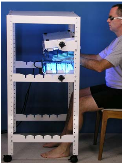
Un ajuste para tratar palma y dorso de las manos simultáneamente